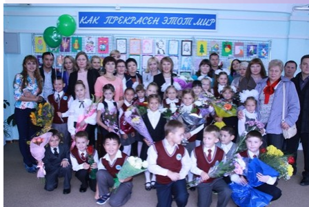
Наш дружный 2г класс